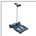
Transportwagen inklusive mit dem Wagen wird der Reinigungsroboter schnell und einfach transportiert und wieder verstaut.