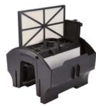
Zugang zu den Filterplatten von oben. Einfache Pflege. Die Filterplatte lässt sich leicht entnehmen, reinigen und wieder einsetzen RCX70101PAK2 (Inbegriffen).