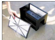
Filterelemente einfach zu entnehmen, zu reinigen und wieder einzusetzen