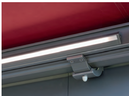
Direkte Beleuchtung beim PERGOLINO: Die «Einschnapp-Technik» ermöglicht eine unauffällige Anbringung.