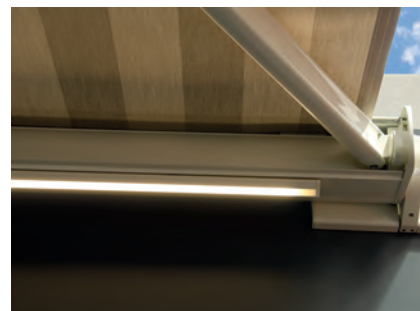
Auch bei nachträglicher Montage wie hier bei der TENDABOX ergibt sich ein homogenes Aussehen.