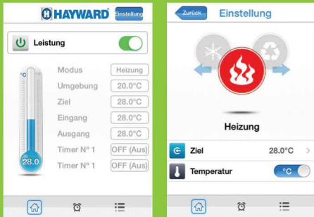
Wahl des Nutzungsmodus