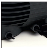
Entleerungsstopfen zum Vereinfachen der Überwinterung