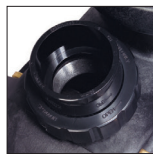
Anschlüsse im Lieferumfang enthalten (50/63 mm)