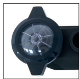
Abdeckung des Vorfilters durchsichtig